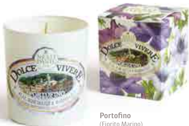
Portofino (Fiorito Marino)