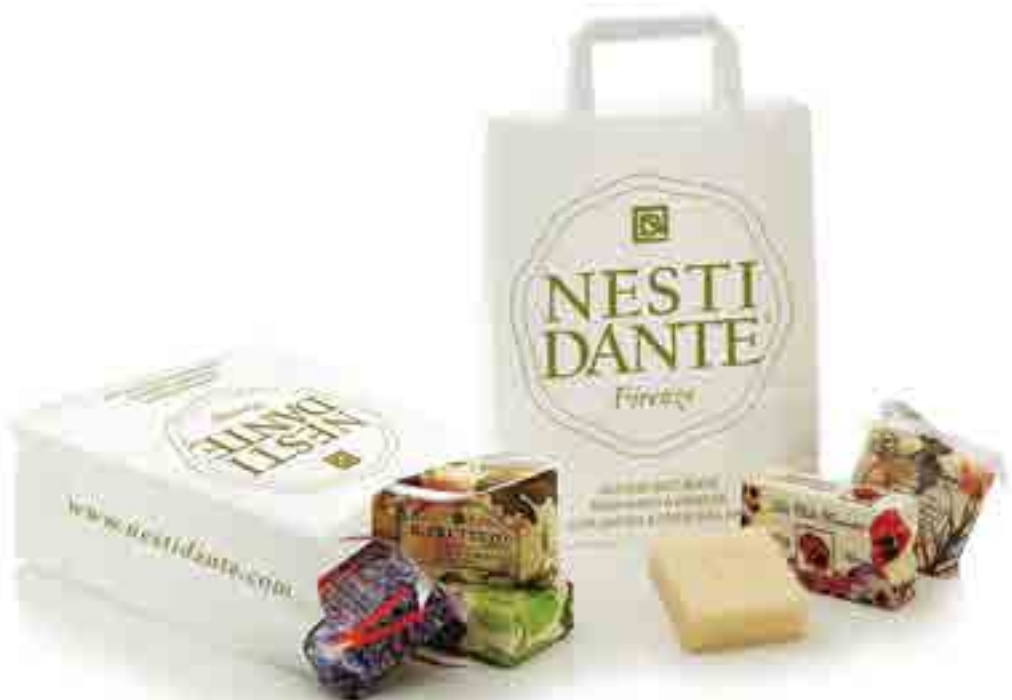
Shopping bag in carta bianca con stampa personalizzata White paper shopping bag with personalized graphics