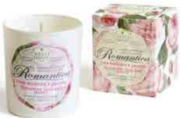
Rosa Medicea e Peonia (Romantica)

Hand made scented candle prepared with natural, biodegradable, vegetable wax. Vegan friendly, no animal ingredients-ever. Cruelty-free. 100% cotton wick, lead free. Up to 30 hour burn time.