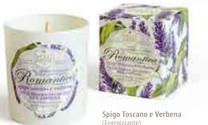
Spigo Toscano e Verbena (Energizzante)