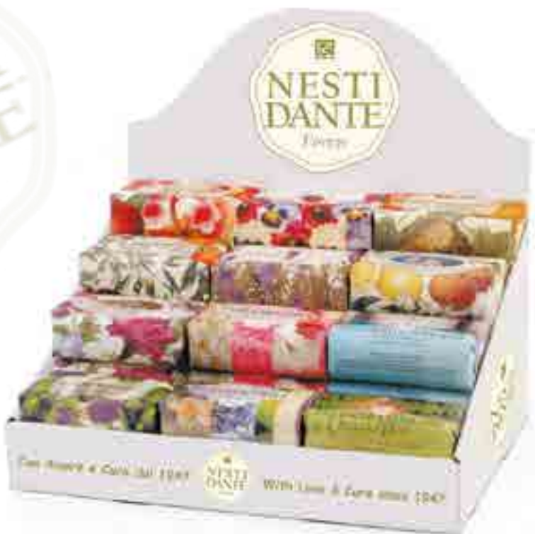
Espositore in cartone, contiene 30 saponi da 250 gr. Cardboard counter dispenser, contains 30 soaps x 250 gr./8.8 Oz