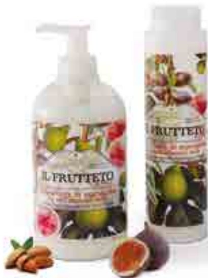
Fig e Latte di Mandorla

Le magie olfattive di un frutteto toscano esaltano il caldo cuore del fico con la dolcezza del latte di mandorla in un sapone liquido arricchito dal principio attivo della mandorla e delicato su ogni tipo di pelle, anche quelle più bisognose di rispetto.