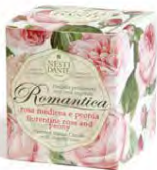
Rosa Medicea e Peonia (Romantica)