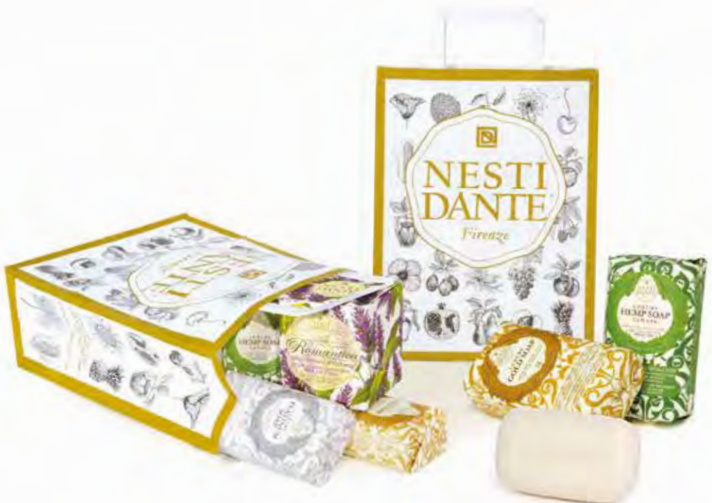
Shopping bag in carta bianca con stampa personalizzata White paper shopping bag with personalized graphics