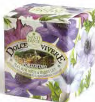
Portofino (Fiorito Marino)