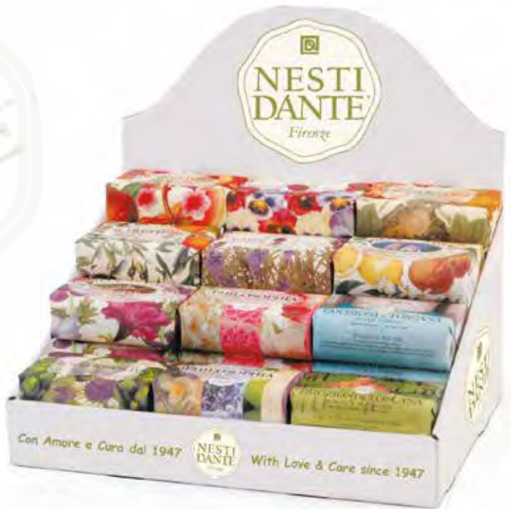
Espositore in cartone, adatto per 30 saponi da 250 gr. Cardboard counter dispenser, fit for contains 30 soaps x 250 gr./8.8 Oz