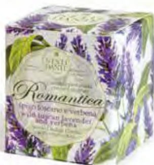
Spigo Toscano e Verbena (Energizzante)