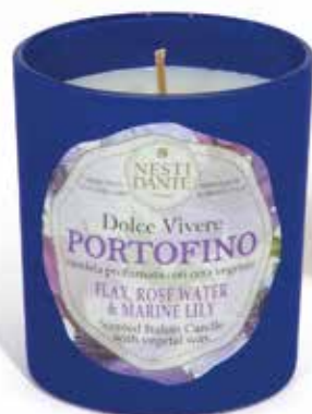
Portofino (Fiorito Marino) Portofino (Sea Flower)