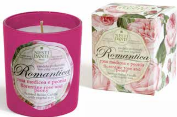
Rosa Medicea e Peonia (Romantica)

Hand made scented candle prepared with natural, biodegradable, vegetable wax. Vegan friendly, no animal ingredients-ever. Cruelty-free. 100% cotton wick, lead free. Up to 30 hour burn time.